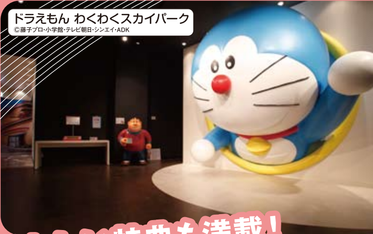
ドラえもん わくわくスカイパーク