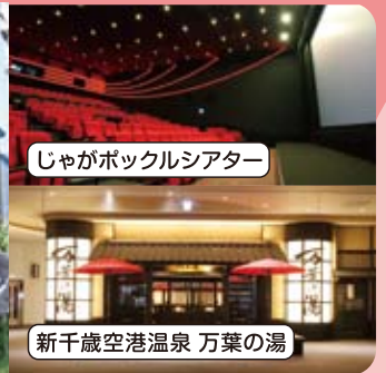
じゃがポックルシアター