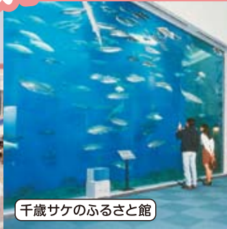
千歳サケのふるさと館