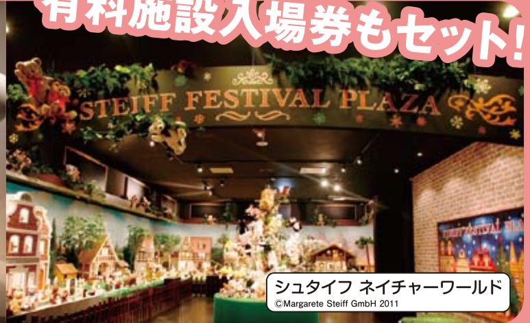
シュタイフ ネイチャーワールド