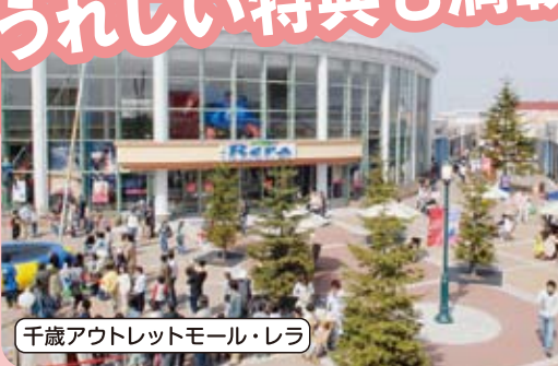
千歳アウトレットモール・レラ